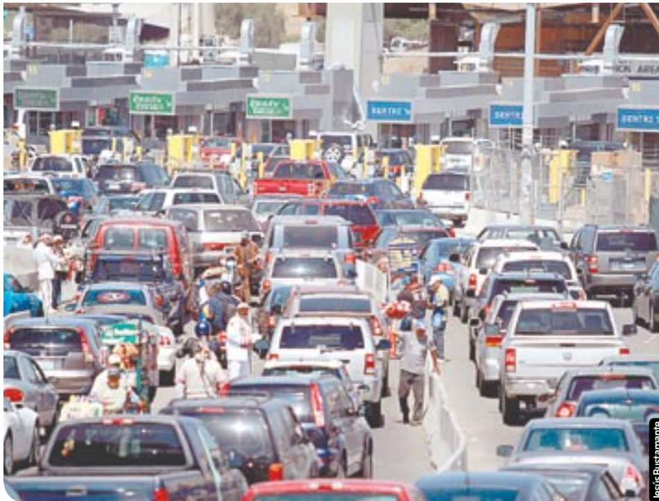
El recorte tuvo repercusiones en la operación de los puertos fronterizos.

El reporte emitido este 12 de abril señala que el recorte federal que inició